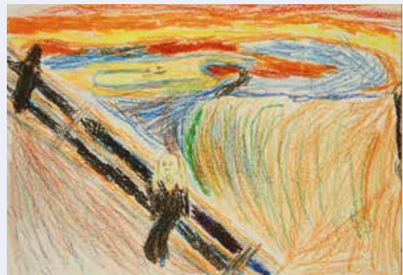
Der Schrei von Edvard Munch

Kinder haben sich an großer Kunst versucht. Es ist ihnen gelungen