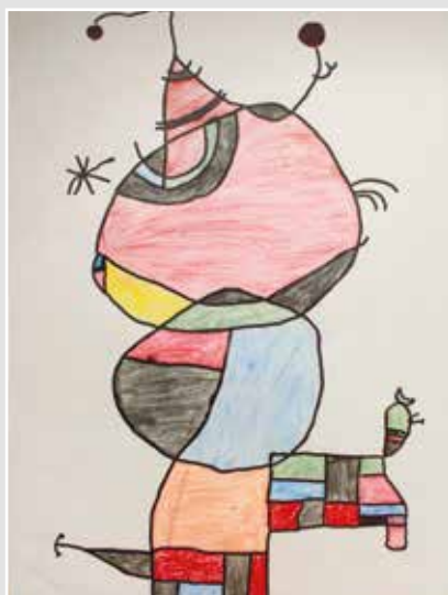
Frau, Vogel und Stern von Joan Miró