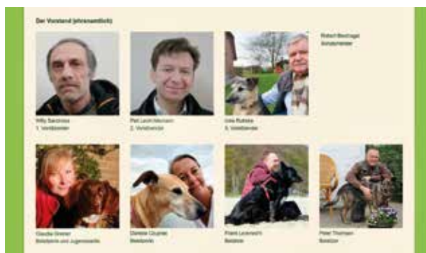
Website des Tierheims Flensburg mit den Vorständen

Man kann dem Tierheim helfen, indem man Futter oder Geld spendet. Dies hat unter anderem auch der SBV getan. Wer gern in der Nähe von Tieren ist, kann zum Beispiel mit Hunden Gassi gehen.