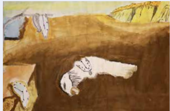
Beständigkeit der Erinnerung von Salvador Dalí