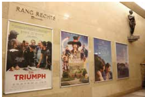
Eindrücke aus dem Foyer – mit einem Projektor aus vergangener Zeit als Dekoration