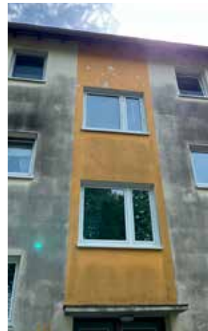
Fassade im Marrendamm vor und nach dem neuen Anstrich

Einige aus der Befragung abgeleiteten Maßnahmen gehören zum Tagesgeschäft unseres Haus- und des Gartenservice sowie des Bestandsmanagements: unter anderem die Pflege der Beete, des Rasens und der Hecken oder Sauberkeit in den Bereichen zwischen den Gebäuden. Anderes fällt unter die so genannte