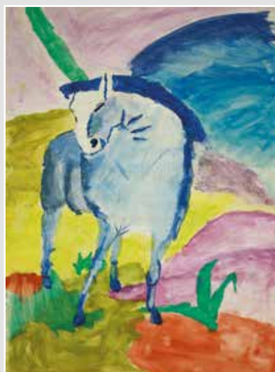
Blaues Pferd von Franz Marc