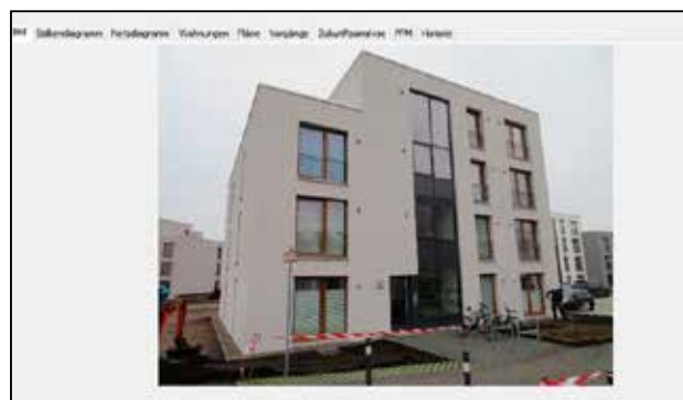
Blick in die Software meviso. Sie liefert auf einen Klick Informationen zum ausgewählten Gebäude, einschließlich aktueller Fotos vom Bestandsobjekt