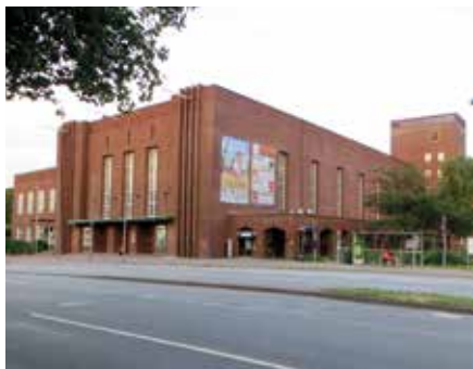
Das „51 Stufen“ im Deutschen Haus