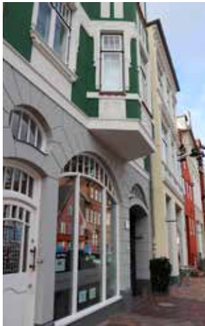
Hier in der Norderstraße wurden und werden die Fassaden neu gestrichen

„Unseren Bestand haben wir immer im Blick“, sagt Jessica Behrend, Bereichsleiterin des SBV-Bestands-