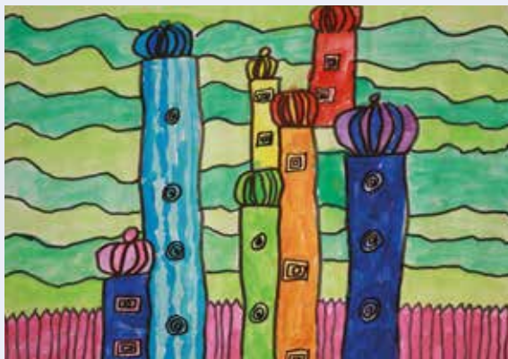
Gemälde im Stil von Friedensreich Hundertwasser