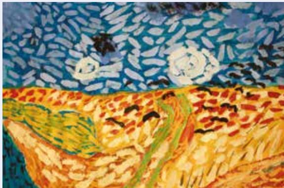
Weizenfeld mit Krähen von Vincent van Gogh