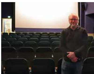
Im Kinosaal ist Platz für 120 Besucher