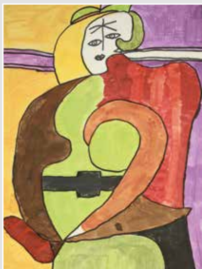
Der rote Sessel von Pablo Picasso