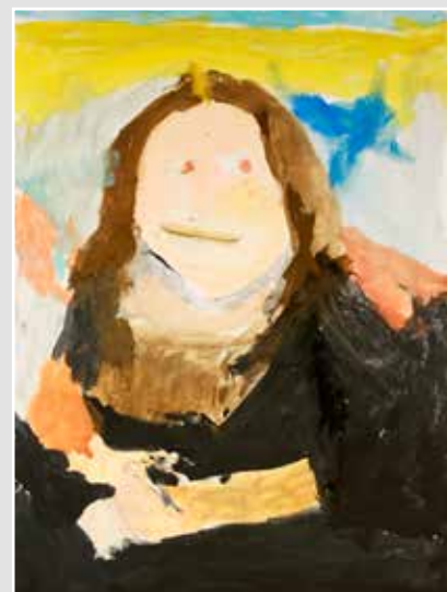
Mona Lisa von Leonardo da Vinci

Von Kindern nachgemalte Werke berühmter Meister