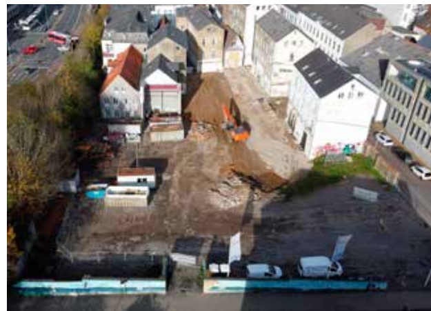
... und nach dem Rückbau

Darüber hinaus waren Baukörper, die zurückgebaut werden mussten, „teilweise massiv wie Bunker